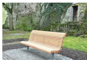
Spendenprojekt ‚Bürgerbänke für Backnang‘