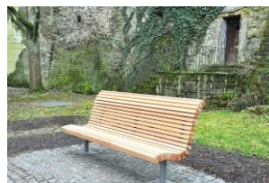
Spendenprojekt ‚Bürgerbänke für Backnang‘