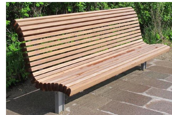
Banktyp Neue Wiesen