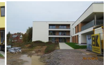
Bonhoeffer-Haus (November 2019)