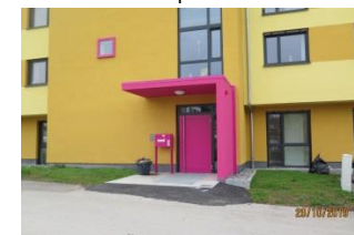
Hospiz (November 2019)